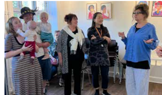
Ferniseringen den 1. maj var velbesøgt. Udover en del lokale naboer slog kunstnerens medstuderende fra en kunsthøjskole i Herlev også vejen forbi.