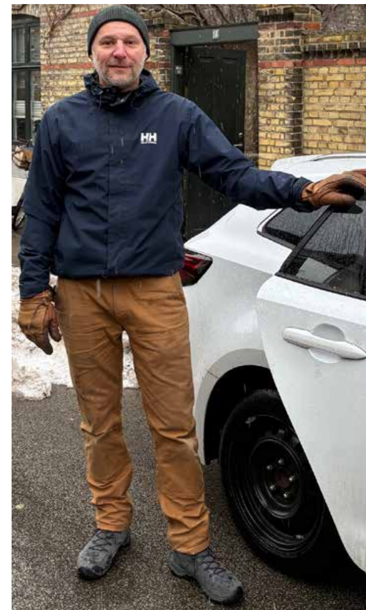
Renaud med bil foran Carstensgade 19 - en fartbøde satte en foreløbig stopper for et dansk statsborgerskab.

”Jeg er helt enig i, at man skal gøre sig fortjent til det