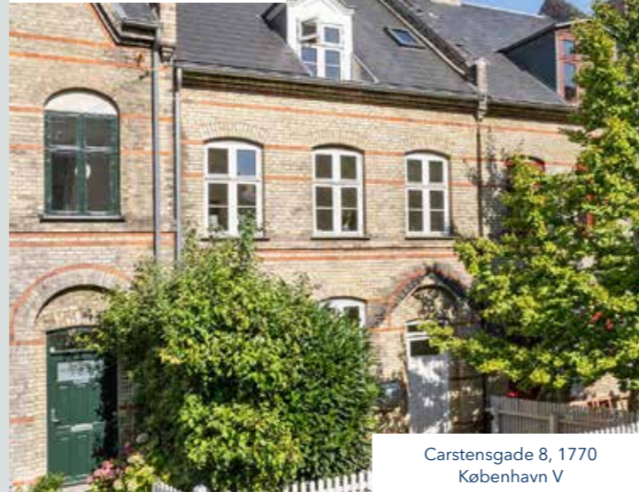
Carstensgade 8, 1770 København V