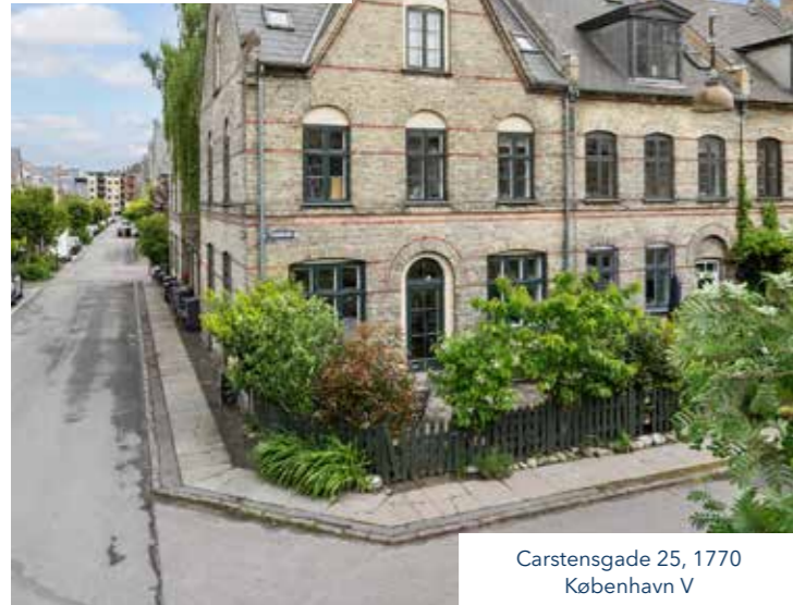
Carstensgade 25, 1770 København V