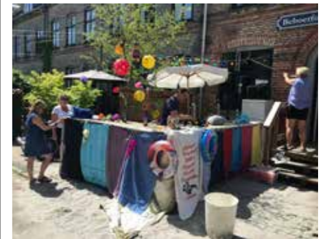
Gadefesten 2022: Baren gøres klar