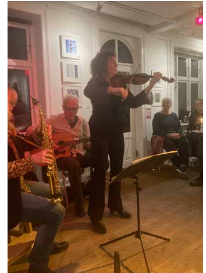
Fiola i Beboerhuset 27. februar.