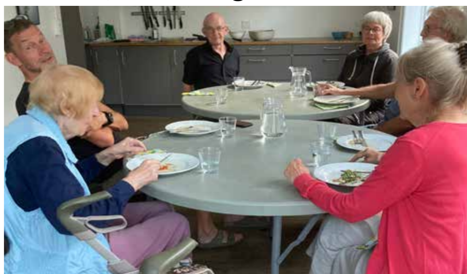
Et snapshot fra denne mandags Farinelli-samling.

altid hjem beriget med synspunkter og emner, som jeg slet ikke vidste var så interessante.