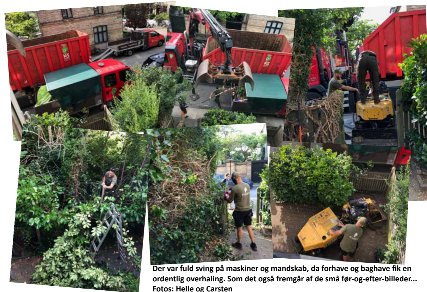
Der var fuld sving på maskiner og mandskab, da forhaver og baghave fik en ordentlig overhaling. Som det også fremgår af de små før-og-efter-billeder...