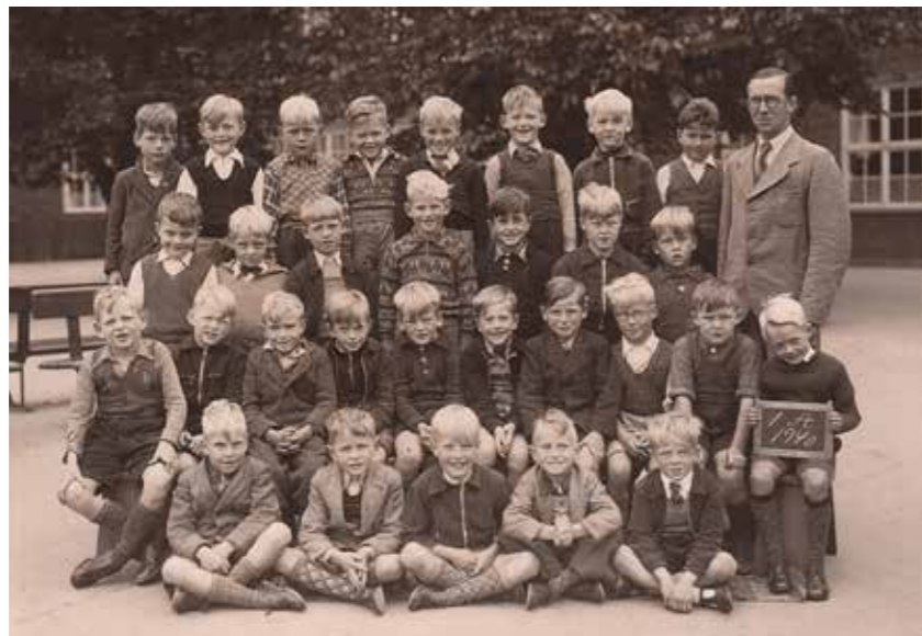
Skolehistorieliv: Her 1 A på Bavnehøj Skole i 1940. Skolen hører til skoledistriktet Vesterbro/Kongens Enghave.