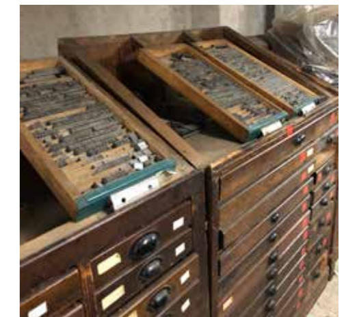
Actum har nylig overtaget Chr. Jørgensens Bogtrykkeri, og nu står det gamle firmas mange skuffemøbler med blybogstaver og alskens grej fra trykkeriets forne tider i Actums kælder, der er et helt trykermuseum værdigt.