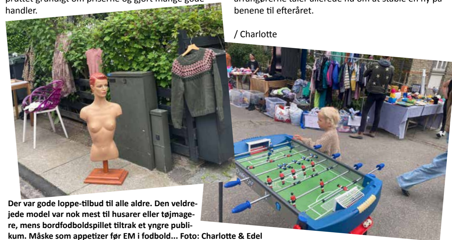
Der var gode loppe-tilbud til alle aldre. Den veldrejede model var nok mest til husarer eller tøjmagere, mens bordfodboldspillet tiltrak et yngre publikum. Måske som appetizer før EM i fodbold...