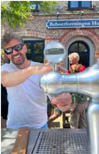
Baren 2023 - den åbner også 8. juni...

INFO om øvrige affaldstømninger i Humleby: https://nemaaffaldsservice.kk.dk