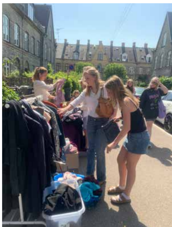
Naboer og gæster fra byen omkring os har været meget flittige kunder i de 30-40 boder, som på markedsdagen er poppet op i gaderne. Nu gentages loppemarkedet 5. maj.

Sidste år opstod Kaffesalonen ved Beboerhuset som et mødested, hvor man kunne beundre sine købskup over en kop