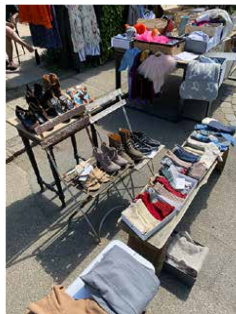
Der var meget at komme efter på de flere end 30 stande.