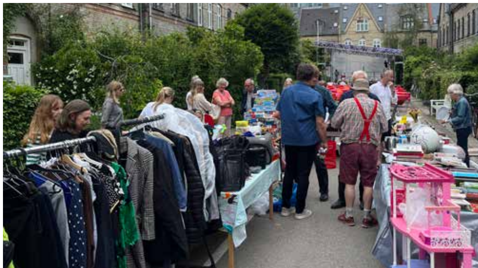
Gadefesthistorie: Billede fra sidste års loppemarked.