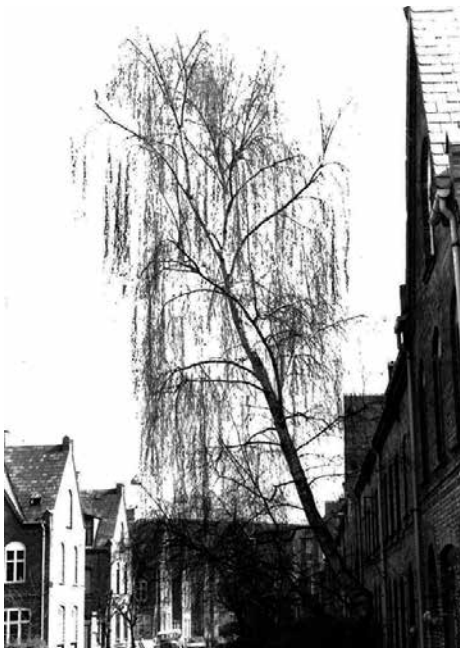
Engang fik træer i Humlebys forhaver lov at vokse ind i himlen. Det gør de ikke mere. Det er forbudt.