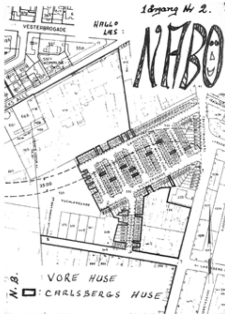
Den dramatiske forside af Nabo første årgang nr. 2.

Og findes Christian Duchs tegninger og mange fotos endnu - i givet fald