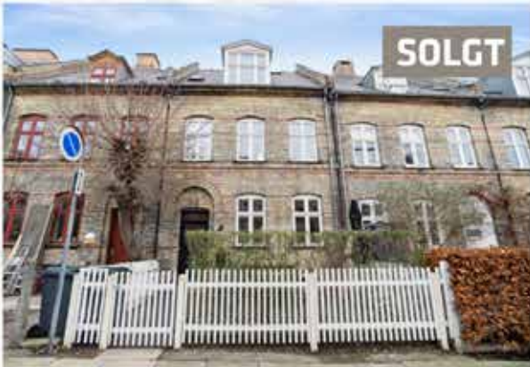
Jerichausgade 5. solgt på kun 12 dage.

Der bliver stadig solgt boliger i Humleby. Med den rette salgsstrategi er det lykkedes os at sælge disse to boliger i februar og marts måned.