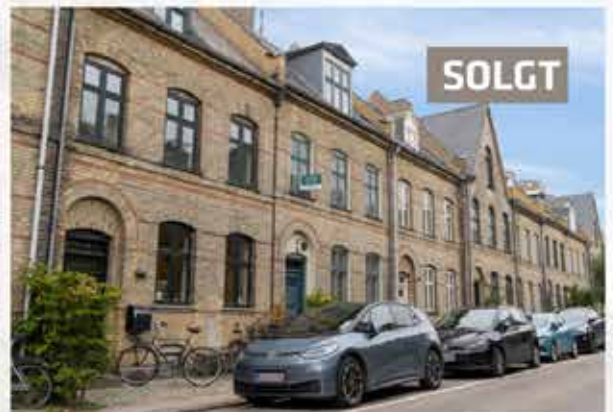
Jerichausgade 46. solgt. Lignende søges.

Kontakt os, så kommer vi gerne forbi til en uforpligtende snak.