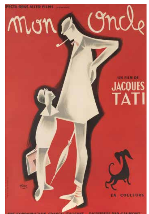
Karakteristisk fransk plakater for filmen