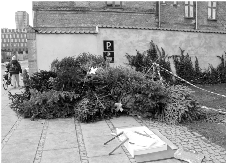
Juletræer og storskrald er dynget op ved Ny Carlsbergs Vej af utålmodige beboere fra boligforeningen på den anden side af Vesterfælledvej.

Piben fik en helt anden lyd i 2011, da private vognmænd overtog