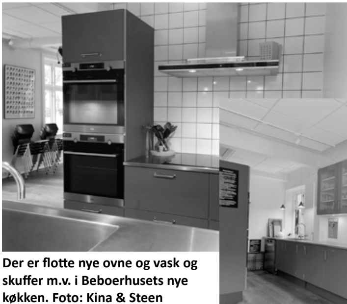
Der er flotte nye ovne og vask og skuffer m.v. i Beboerhusets nye køkken.