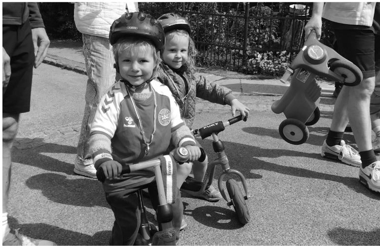
Et par søde miniræsere iført medaljer

Også for fodboldfansene, som havde sørget for pænt store skærme, så de kunne følge med i den vigtige kamp. Derfor blev der godt nok noget stille, da Christian Eriksen faldt om på banen i begyndelsen af kampen - men som aftenen gik, og der kom gode bulletiner fra hospitalet, vendte stemningen tilbage, og der var fuld gang i den, da Luftwaffe sluttede musikken ved midnatstid som foreskrevet Side 6