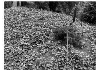
Hegnet i Carlsbergs have

til leg og spil netop i dette område, håber jeg, at de vil sætte et let stålhegn op a la det, man kan finde rundt om bedene i Frederiksberg Have – og såmænd også i Carlsberg Byen.