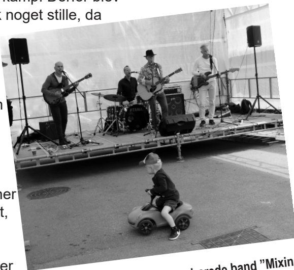
Det fremragende Dylan-inspirerede band "Mixing up the Medicine" startede festen fra scenen. Vi har flere gange hørt dem i torsdagsbaren, hvor de forhåbentlig kommer igen i den sæson, der starter torsdag efter efterårsferien.

Også for fodboldfansene, som havde sørget for pænt store skærme, så de kunne følge med i den vigtige kamp. Derfor blev der godt nok noget stille, da Christian Eriksen faldt om på banen i begyndelsen af kampen - men som aftenen gik, og der kom gode bulletiner fra hospitalet, vendte stemningen tilbage, og der var fuld gang i den, da Luftwaffe sluttede musikken ved midnatstid som foreskrevet Side 6