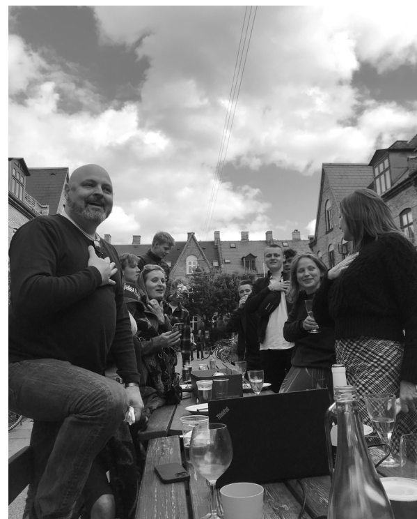
Der er et yndigt land - optakten til et dramatisk fodboldeventyr

Men det blev en dyr fest. Underskuddet blev omkring 35.000 kroner mod 981 kroner ved sidste gadefest i 2019, se vedlagte skemaer. Så manglede der selvfølgelig små 9000 fra