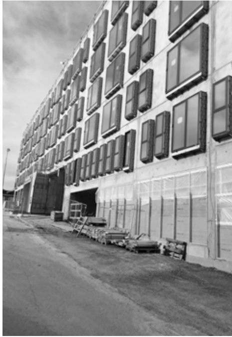
Byggepladsen med facaden til Caroline Hus, set fra J.C. Jacobsens Gade.

Caroline Hus kommer til at rumme 80 boliger i forskellige størrelser fra 1 til 6 værelser samt en stueetage med høje glaspartier tiltænkt detailhandel. Huset opføres som en karré, der omkranser en grøn gård, hvor der er plads til leg og ophold. Det er bygget sammen med et af Carlsberg Byens ni tårne, Dahlerup Tårn, som er tegnet af