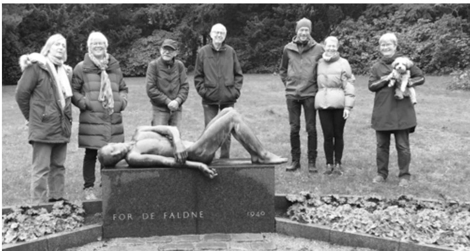
Humblebyboere fra Hold 1 ved statuen af Arne Bang.

Vi kom forbi den dansk-grønlandske polarforsker Knud Rasmussens store gravsten, der knejser højt