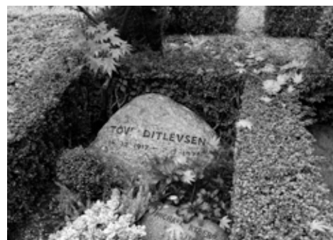
Tove Ditlevsens grav.