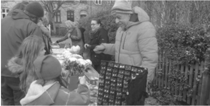
Julemarked bliver der i år - som i 2019.

* 14:00 julemarked starter - * 16:00 juletræet tændes