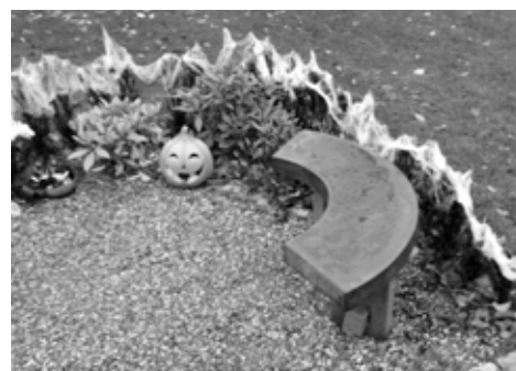
Halloween var også nået ind på kirkegården.