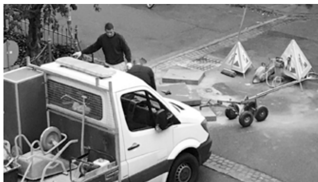
Før, under, efter: Fortovet er på fode igen..