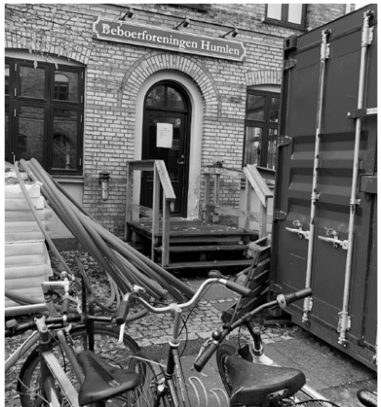
Beboerhuset eksisterer skam - men i skjul bag vandrørsprojektets opmagasineringsbehov.