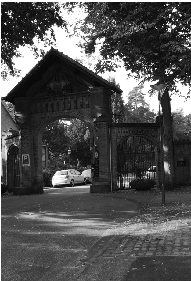
Hovedindgang på Vestre Kirkegårds Allé