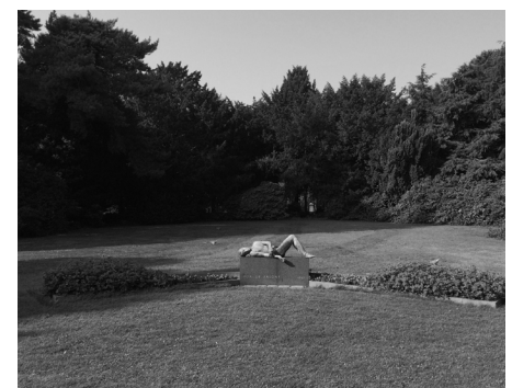
Mindesmærke for de faldne i 2. Verdenskrig