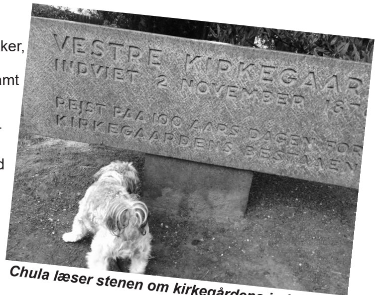
Chula læser stenen om kirkegårdens indvielse

Hær, katolikker, jøder og muslimer samt for kristen-ortodokse og dem, der ikke ønsker en grav med religiøse symboler. Færinger har haft deres egen afdeling siden 1912, mens grønlændere måtte vente til 1948 med at få deres. Kirkegården rummer også 2 hektar med tyske soldater- og flygtningegrave. Desuden er der flere urnehaver og afsnit med unavngivne fællesgrave.