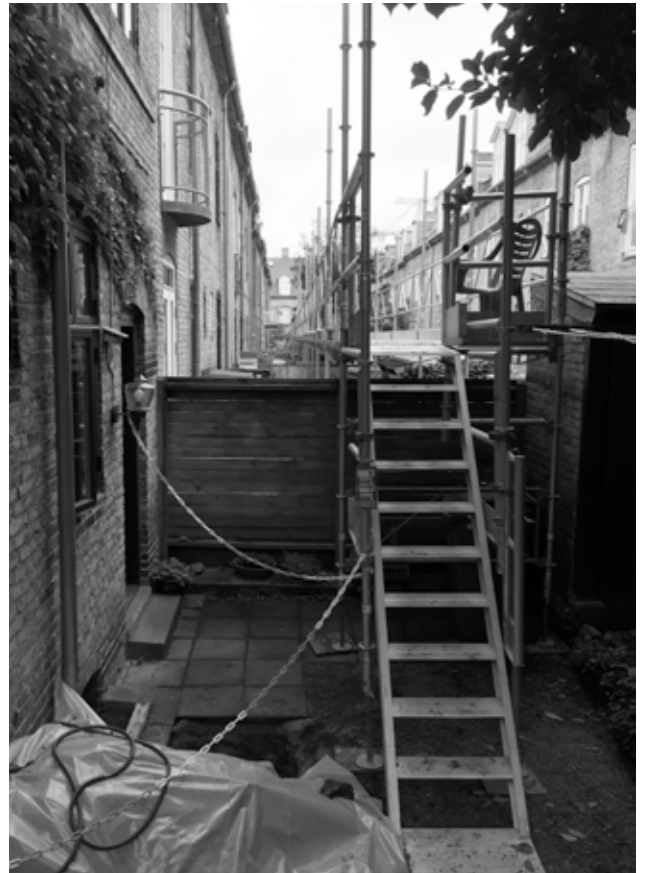
Sidste år var det baghaverne i Bissensgade op mod Jerichausgade, der stod for pilotprojektet. Nu er det andres tur til at få nye vandrør.