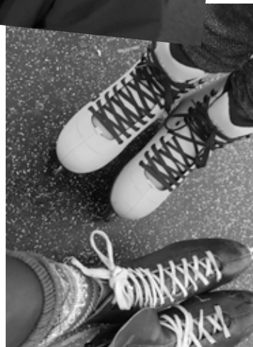
Nye og gamle skøjter - de flotte nye farver må man tænke sig til