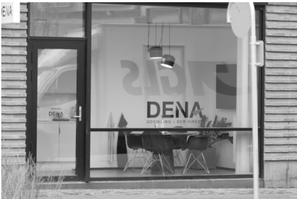
DENA ligger på Ny Carlsberg Vej 48 - på hjørnet af Vesterfælledvej og har en GLS-pakkeshop som endnu en af Humlebys naboer...