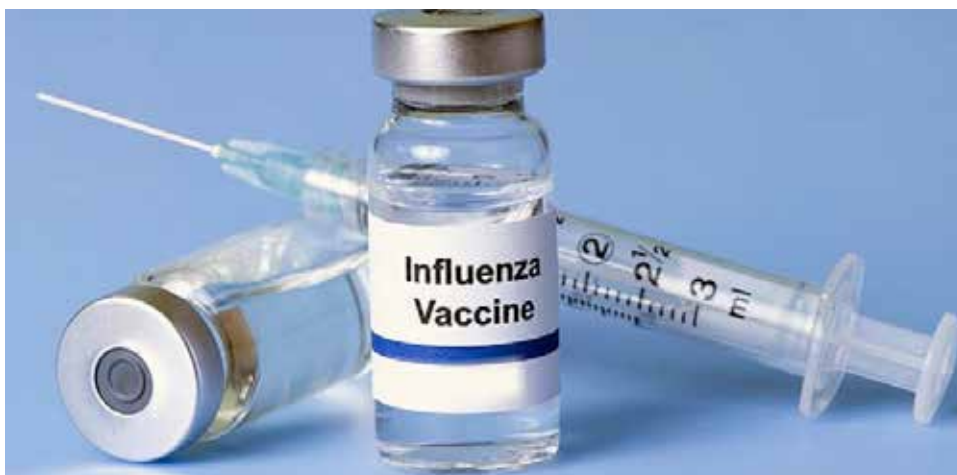
Influenzavaccination skal gå ordentligt for sig.