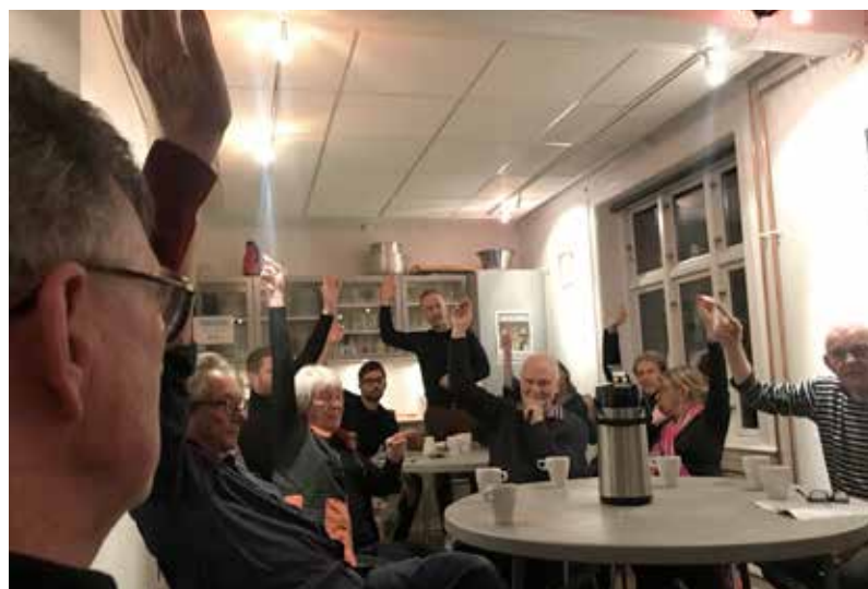
Et historisk øjeblik: Der stemmes ja til at overdrage Beboerhuset til Husejerforeningen.

»Som en selvstændig forening uden tvunget medlemskab kan vi agere, som vi har lyst til. Husejerforenin-