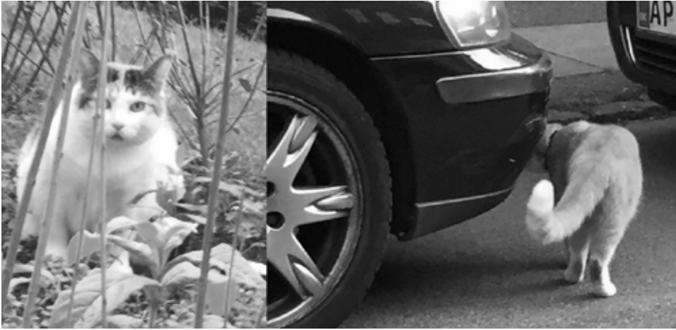
Det lykkedes ikke at få en af kvarterets katte i tale til denne artikel - de var ikke glade for NABO's snagen i snigeriet....