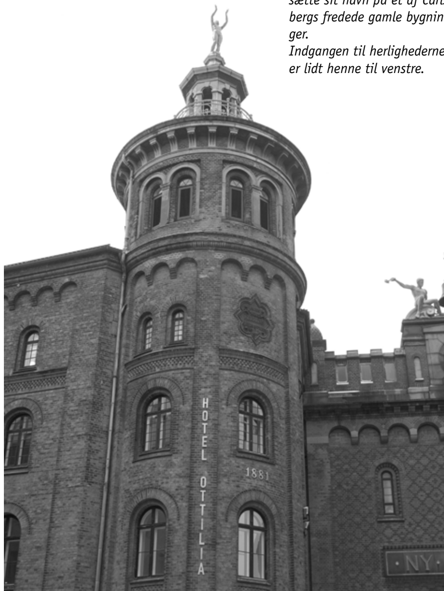
Hotel Ottilia har fået lov at sætte sit navn på et af Carlsbergs fredede gamle bygninger. Indgangen til herlighederne er lidt henne til venstre.

te spøjse rum ved ho- ts foyer og bar på før- al kan hver tors- fra 16-18 få gratis oplevelser. t torsdag spillede og Kira Skov.