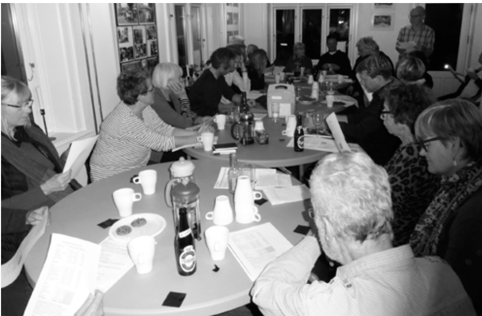
Der er vigtige spørgsmål at tage stilling til på næste generalforsamling.