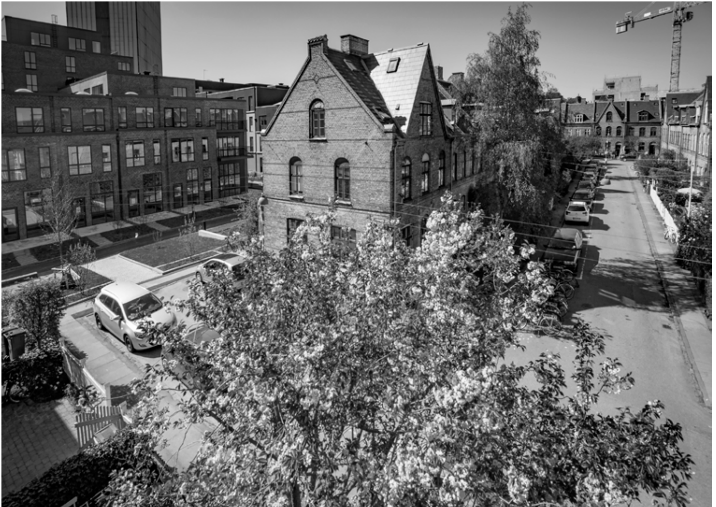
Det er nærliggende at invitere de nye naboer med til fest i Humleby i hvert fald set her fra .