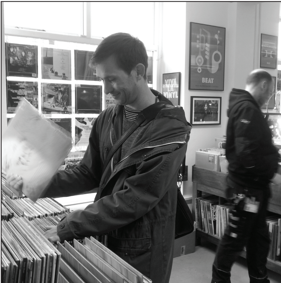
Vinylelskeren i sit Mekka.