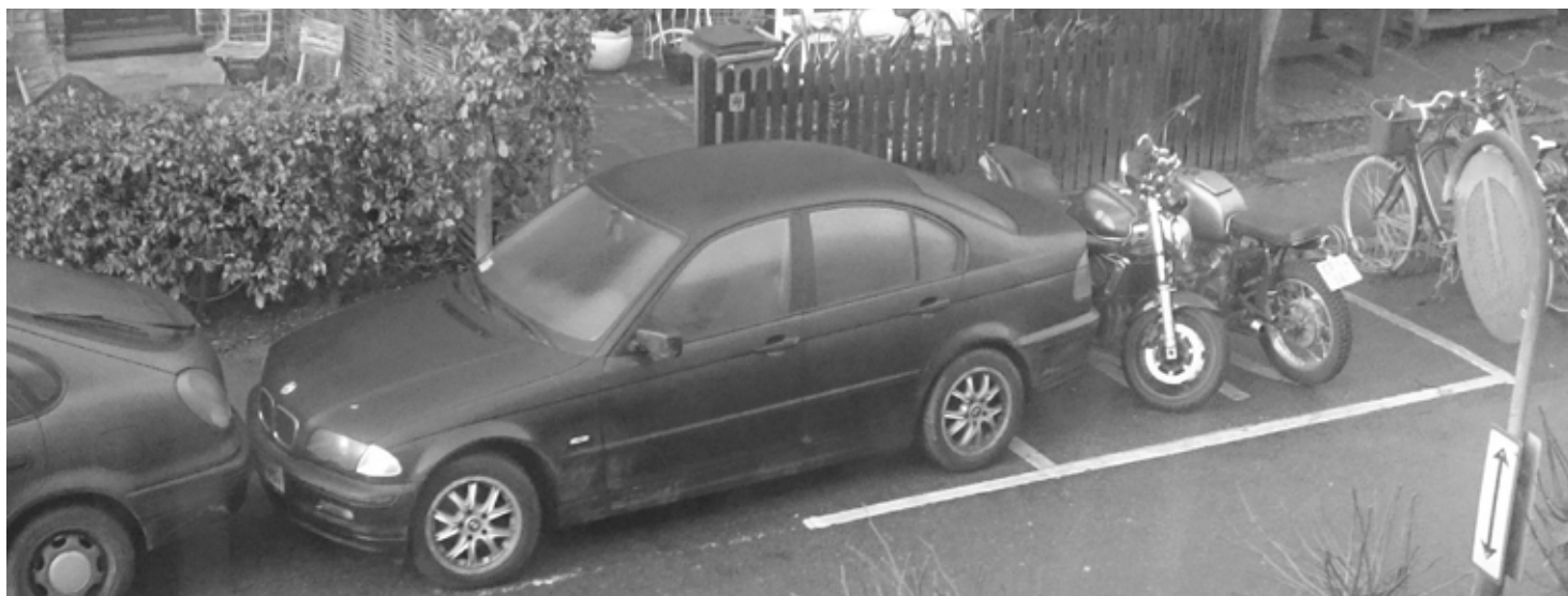
Denne bil æder næsten en meter af Humlebys eneste autoriserede P-plads til motorcykler. Det ser ud til at have været svært at få den ud uden at vælte mindst én motorcykel.