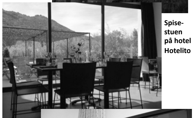
Spisestuen på hotel Hotelito