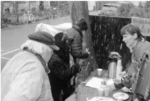
Varm kakao og fastelavnsboller med lyserød glasur.

Kan du gætte hvem jeg er? Som altid var der skruet op for de flotte og kreative udklædninger blandt store og små!