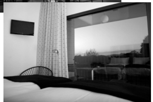
Udsigten fra et af hotelllets værelser