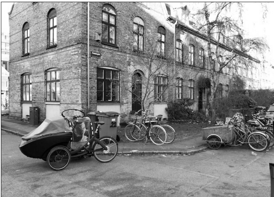
Cykeltransporter på afveje på hjørnet af Küchlersgade og Freundsgade, efter at skraldemændene måtte flytte på cyklerne for at kunne komme til at hente affaldsbeholdere.

Men henstillinger til cykelejere og -brugere hjælper ikke - og det bety-