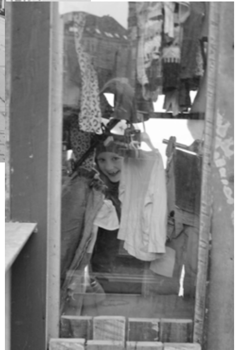
Træhytten på hjørnet af Dybbølsgade og Sønder Boulevard blev indviet i november 2017. Den har døre og vinduer, der åbnes og skydes til side for sjove rum, hylder og skuffer på alle leder og kanter.