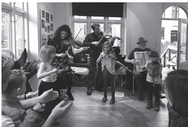
Tre meget dygtige Humlebybørn spiller koncert med Donau Swing til Torsdagsbar for børn i foråret 2017.