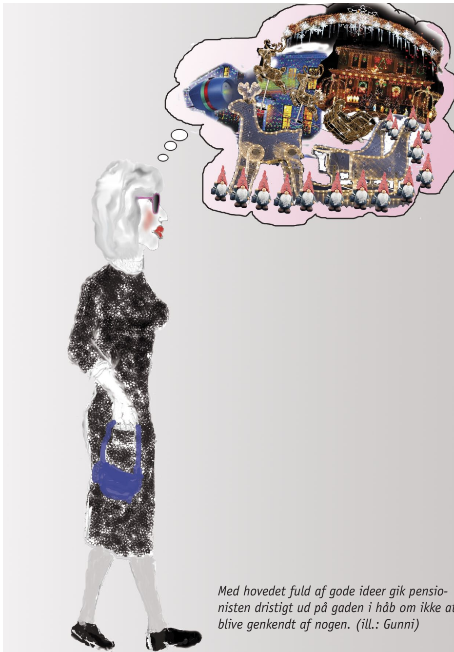
Med hovedet fuld af gode ideer gik pensionisten dristigt ud på gaden i håb om ikke at blive genkendt af nogen. (ill.: Gunni)

ikke at afsløre, at der gemte sig en mand indeni. Hovedet over kjolens nydeligt broderede halskrave og især benene, der stak ud for neden lod dog en del tilbage at ønske.