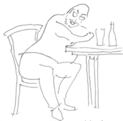
Enhver fuld synger med sit nabo

En meget træt værtshusgæst vågnede ved stilheden og brød ud i ”det er så yndigt at følges ad”, det hævdede stemningen og efter en styrkende Fernet-Branca kunne taxakørslen fortsættes.