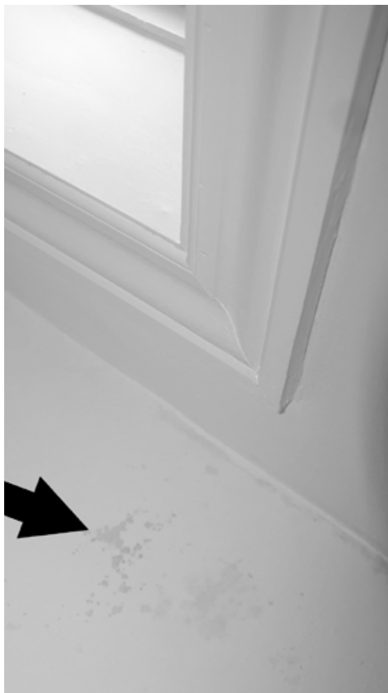
Nyt tag, nyt vindue, nymalet men ikke kønt!