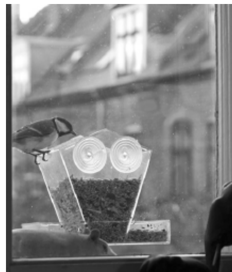
Man kan få endnu mere glæde af Humlebys rige fugleliv ved at trykke en lille gennemsigtig foderautomat fast på ruden – som her på 1. sal i Carstengade 40