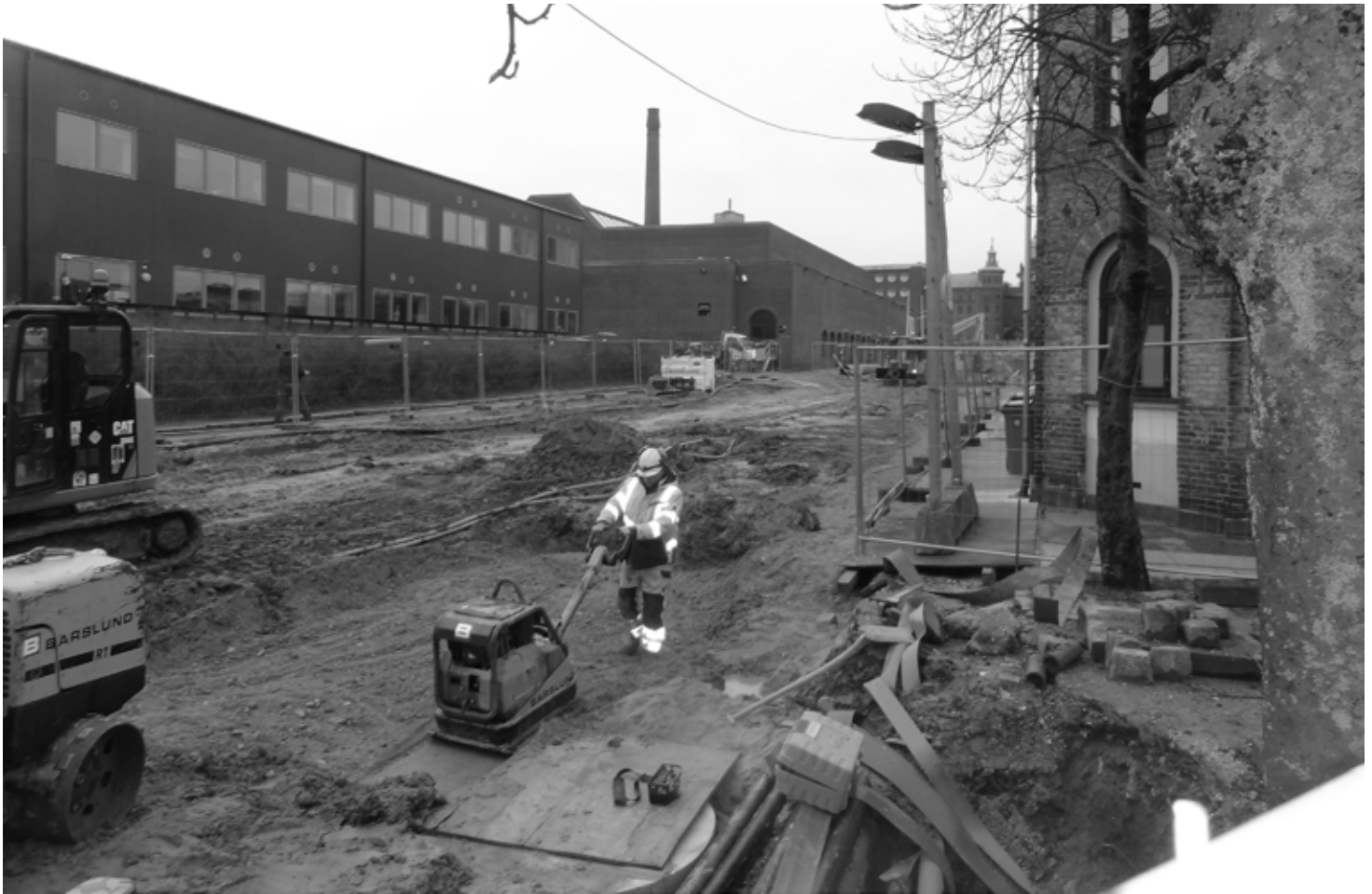
Der er en særdeles god grund til, at arbejderne beskytter sig med høreværn. Men hvad med beboerne?