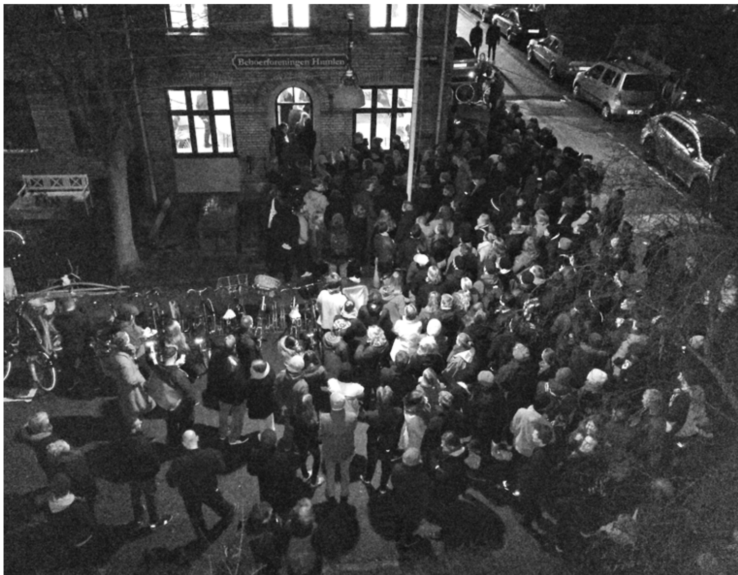
Det blev en travl aften for ansættelsesudvalget. 400 var inde og se på lejligheden.

spillere havde søgt ligesom knap 30 børn af Humleby havde. Læg dertil en kæmpe gruppe af studerende. Kun en enkelt ansøger var flygtning fra Syrien, 11 ansøgere var fra vores Nordiske naboer og ellers en familie fra Ungarn. Yngste ansøger 17 år, ældste 65.