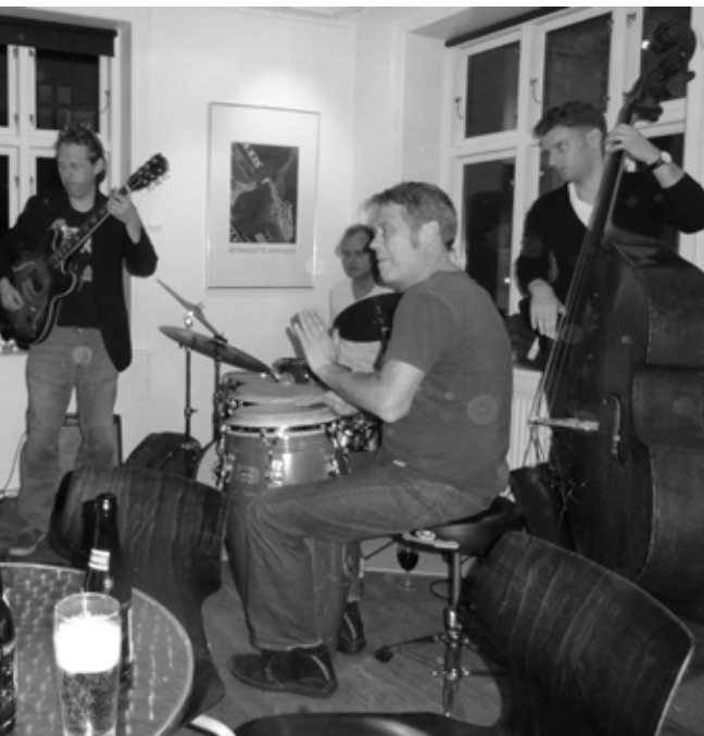
de trommer til en swingende gang jazz.