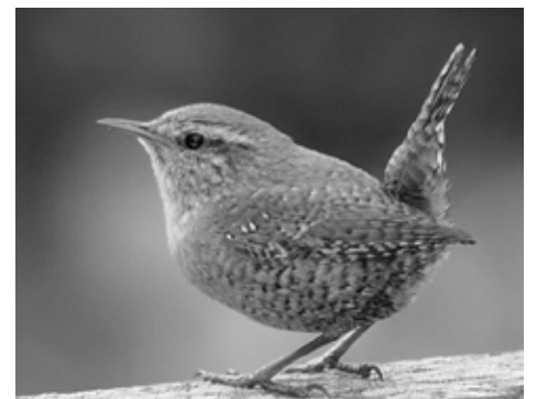
Den lillebitte gærdesmutte er let at kende på den opretstående hale

Siden vi flyttede til i 1996, har jeg registeret over 80 forskellige fuglearter i Humleby i april måned. Så hold øre og øjne åbne, når du er ude – der er nok en fugl i nærheden.