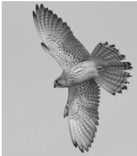
Tårnfalkene har redekasser i toppen af KB-siloen

løvsanger, sangdrossel eller rødstjert. Dette fænomen kaldes fugle-fald og sker ofte efter en klar og stille nat, hvor det pludselig bliver tåget sidst på natten. Småfuglene kommer trækende om natten og rammer ind i tågen. De søger derfor ned til nærmeste grønne busk eller træ, f.eks. i Humlebys haver. Mange forsvinder dog i løbet af dagen, da de søger hen til større grønne områder med mere fred og ingen katte.