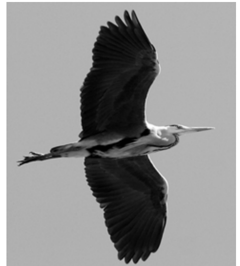
Fiskehejrer ses dagligt over Humleby

opførelser på flere udenlandske scener. Teatret præsenterer Black Diamond som en sci fi-fortælling i et futuristisk billedunivers, hvor mennesket bliver teknologiens marionet. Det er en fremtidsvision, vi har set før, men det bliver spændende at opleve Rushtons udgave, som udspiller sig i et dystopisk landskab med vulkaner, klipper og aske, mens bagscenen – formet som kæmpestor diamant – funkler og gnistrer. Musikken leveres (på bånd) af folk som Alexander Balanescu, Trentemøller og Philip Glass. danskdanseteater.dk .