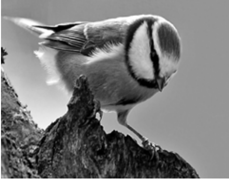
Blåmejse har travlt i denne tid

dens æg eller unger. I øvrigt hjælper husskaderne de andre fugle med at holde vagt og advarer, hvis en af Humlebys mange katte kommer for tæt på.