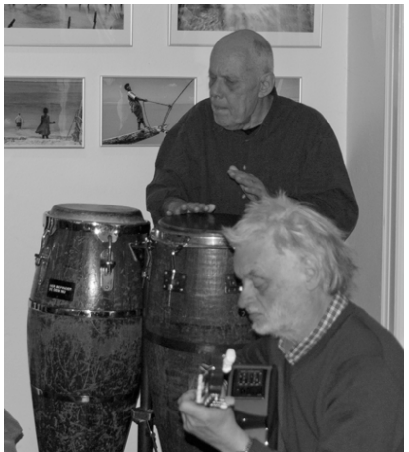
Quist Møller rundede sæson af med Flamenco. (th.)