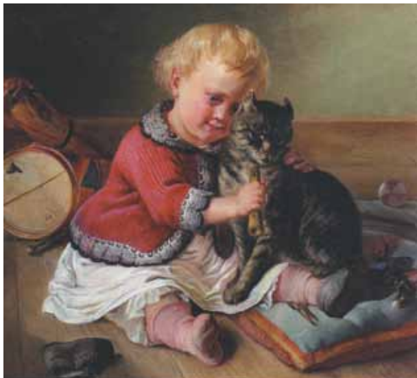
Elisabeth Jerichau Baumann, Lyshåret pige, der leger med sin kat.