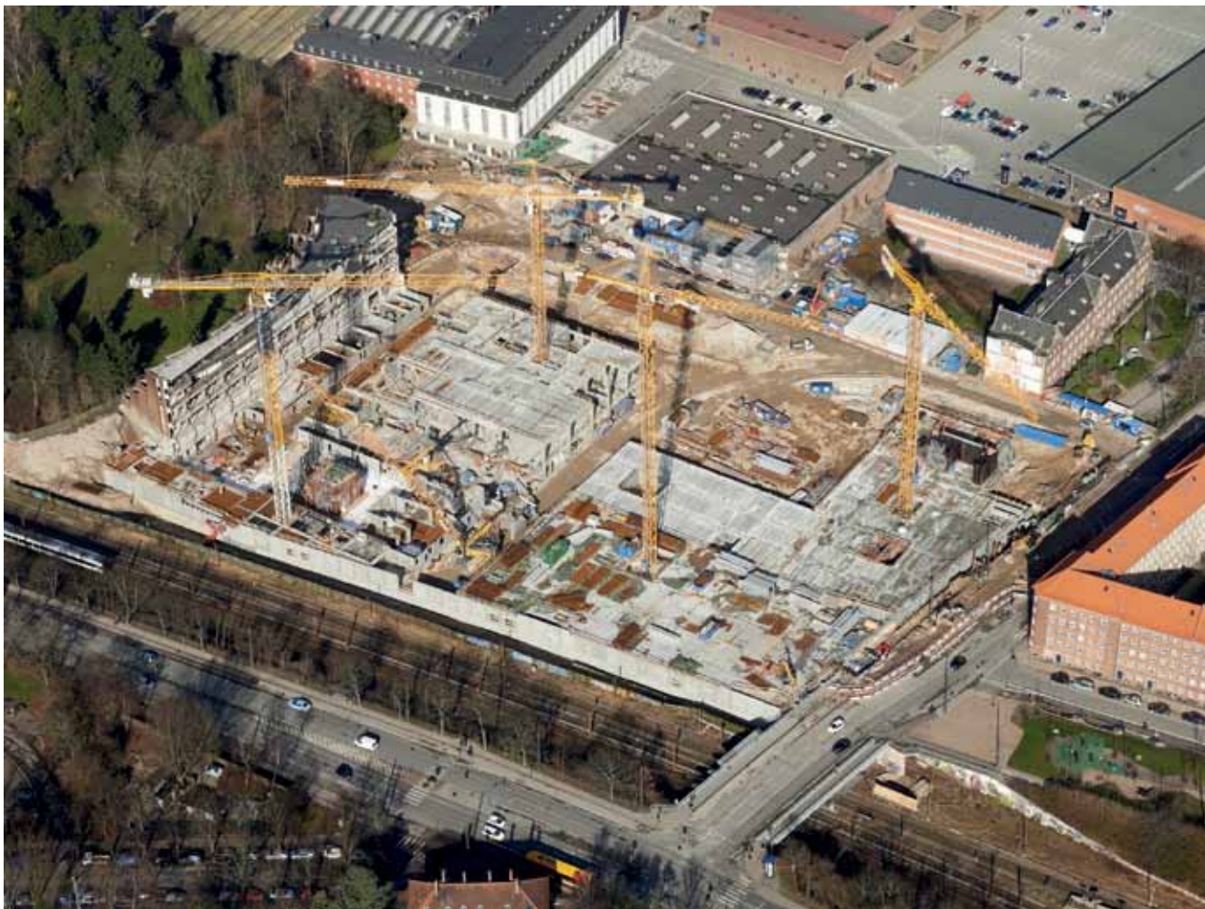
marts 2014 ▲ september 2014 ▼