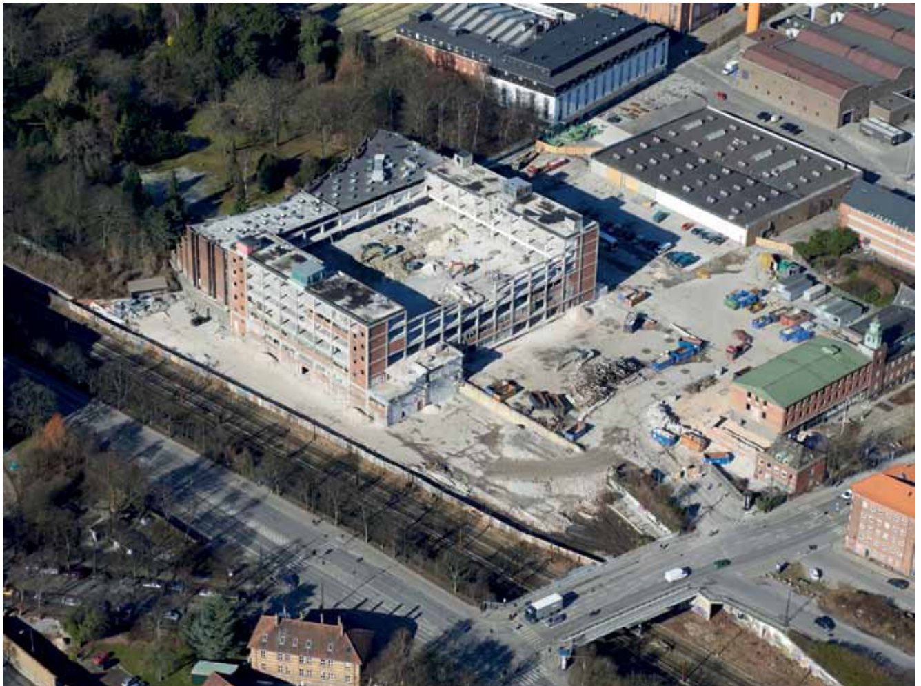
Det går stærkt inde hos naboen nu. Her er fire snapshots af byggeriet på Carlsberg gennem det sidste 1½ år.