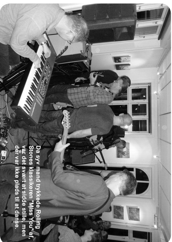
Da syv mand trykkede Rolling Stones klassikeren "Miss You" af, var det svært at sidde stille, men der var ikke plads til at danse.

Fri entree og øl, vand og vin til rimelige priser.