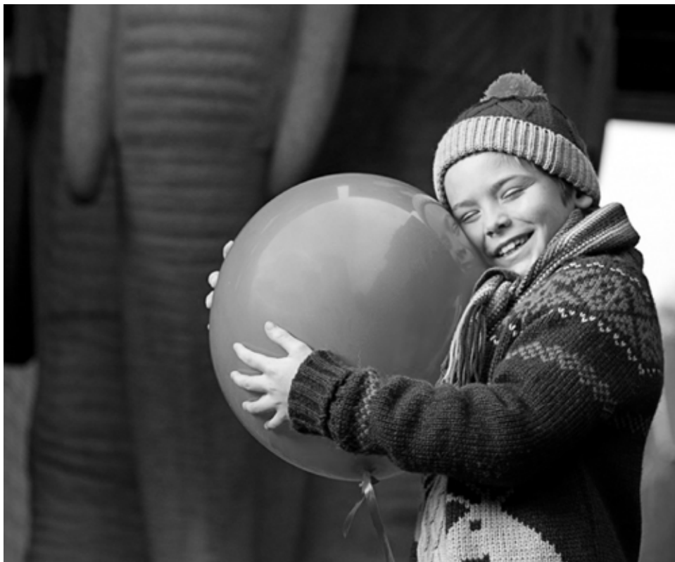
Den Røde Ballon