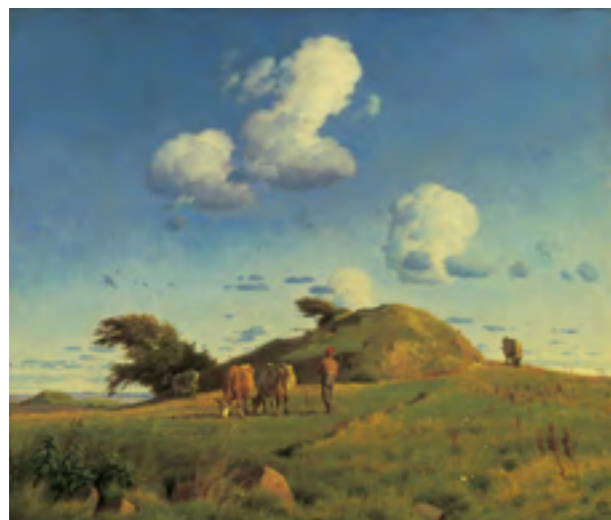
Et efterårslandskab af J. Th. Lundbye

I Frederiksberg Have står Bissens statue af Frederik VI.