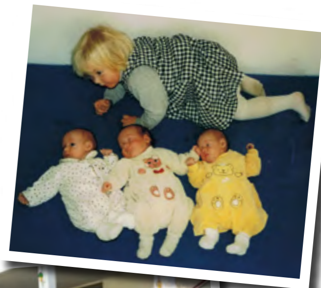
Der var et billede af trillingerne i Ernst Meyersgade i NABOs 25 års-jubilæumsnummer. Og her er de igen.

En institution, som det er umuligt at komme udenom, når man