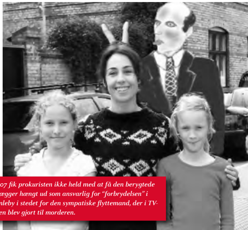
I 2007 fik prokuristen ikke held med at få den berygtede rørlægger hængt ud som ansvarlig for "forbrydelsen" i Humleby i stedet for den sympatiske flyttemand, der i TV-serien blev gjort til morderen.

Ind imellem følger han tidernes op- og nedgang. Da huspriserne begynder deres himmelflugt først i 90'erne, sælger han sit hus og flytter ind på D'Angle-