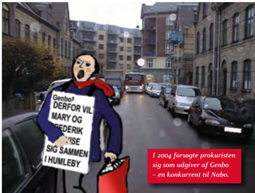
I 2004 forsøgte prokuristen sig som udgiver af Genbo – en konkurrent til Nabo.