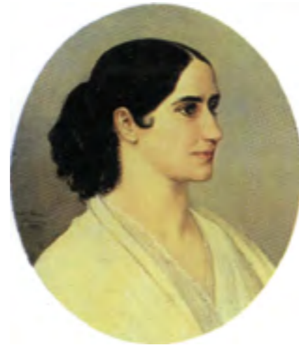
Johanne Louise Heiberg blev malet af Elisabeth Jerichau Baumann