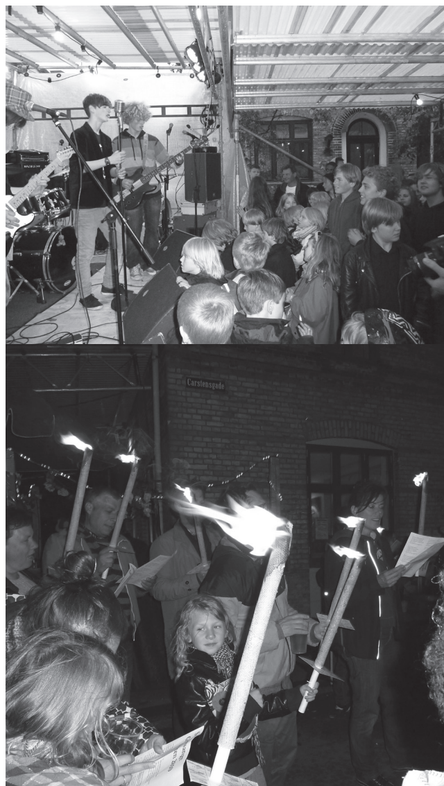
Edel Gadefesten 2011, trods regnvejr var der forrygende stemning hele dagen