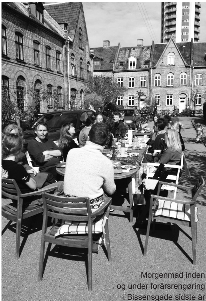
Morgenmad inden og under forårsrengøring i Bissensgade sidste år