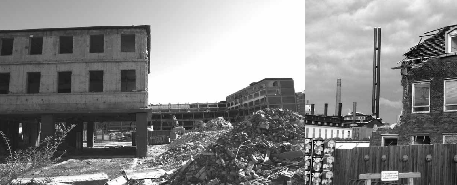
Nedrivning i første række.