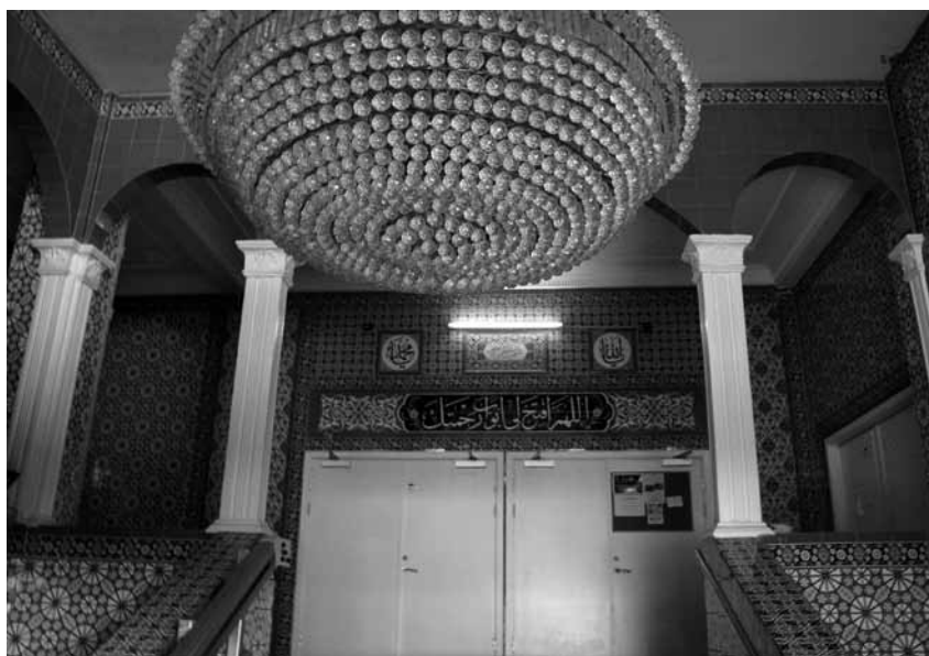
Fra Trøjborggade går man ind under en imponerende prismekrone til et trappeparti beklædt med smukke blålige fliser.