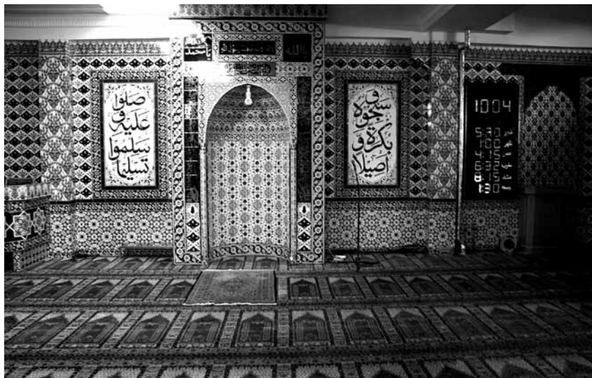
Den mørke tavle til højre viser døgnets 6 bede-timer.

Men indenfor en så smuk helligdom, at det er indlysende, at man tager skoene af for ikke at