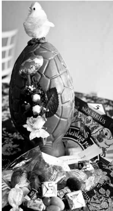
Den helt essentielle Påsketradition i Island er et ordsprog som man får ind i de dejlige Chokolade ægg, alle islændinge bare må have.

Det værste var, at heksene vendte hjem næste dag og gik lige fra fest med djævelen til kirke og til alters. Af den grund var der flere mennesker – især på Bornholm, siges det – som opgav altergangen eller simpel-