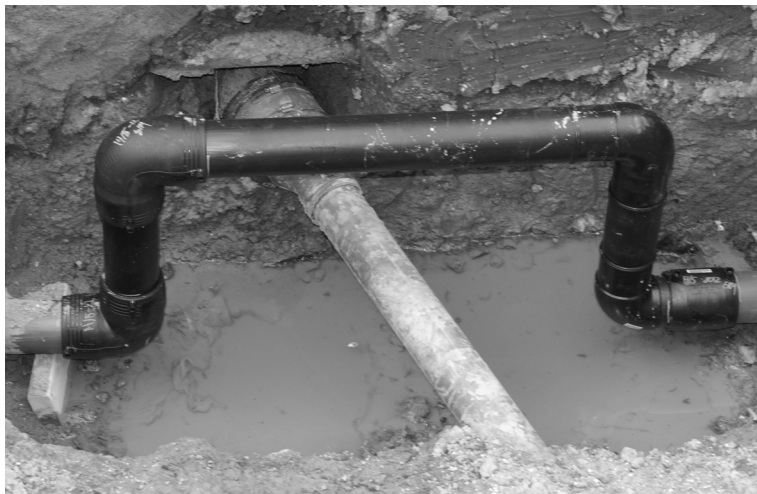
Bypass operation i Carstensgade maj 2012.

For ni mdr. siden i maj blev der gravet op foran Beboerhuset. Der blev konstateret sammenstød mellem hovedvandleddningen og et kloakrør fra Carstensgade 40. Et sammenstød mellem Beboerhusets kloakrør og fjernvarmeledningen blev overset.