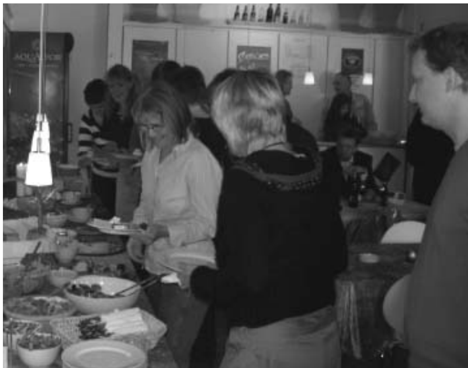
Bufetten er righoldig på sund og lækker mad

Madglad satser ikke på et bestemt publikum. Blandt andet derfor bliver økologi ikke prioriteret. Økonomien spiller selvfølgelig en rolle, men det vigtigste er at nå bredt ud og få folk til at spise mere grønt og mindre kød. Gæsterne er da også en broget flok. Ved frokosttid kommer mange unge