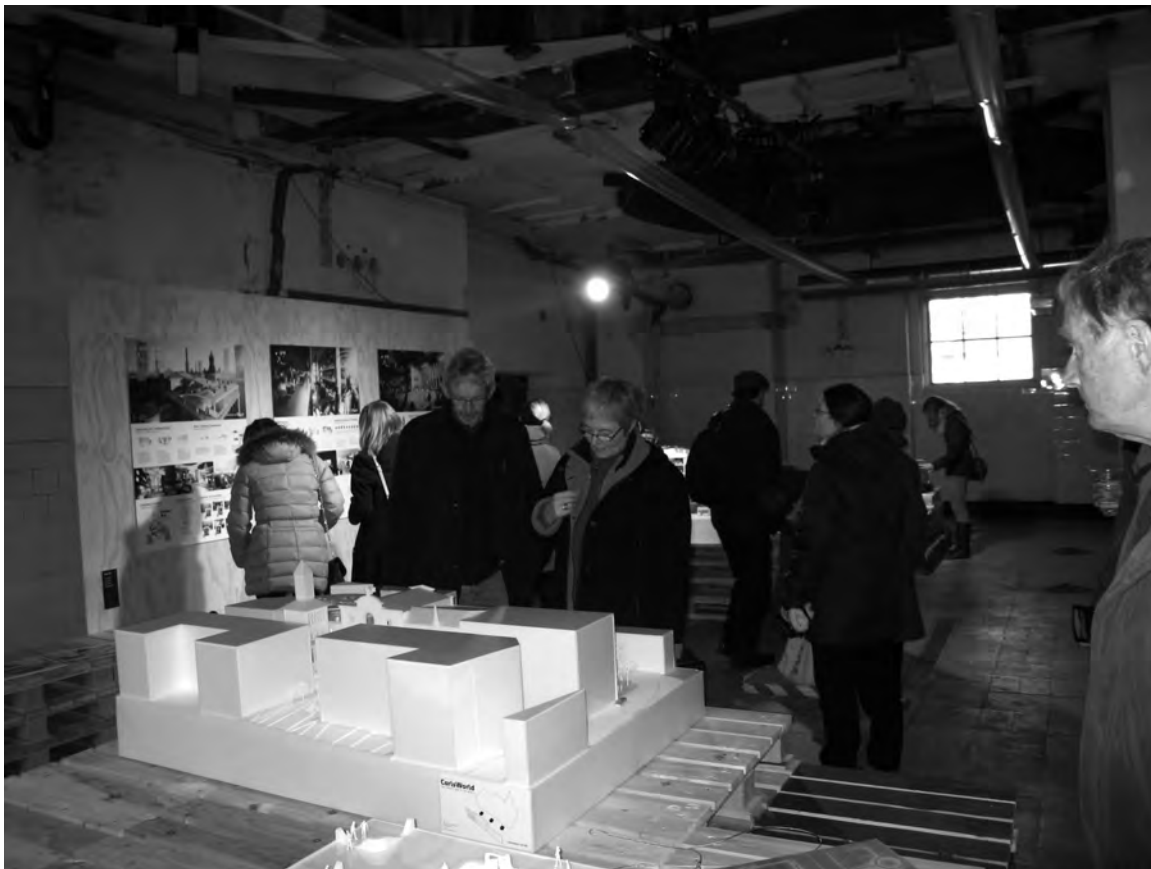
Der var mange gæster til Carlsbergs åbne hus – også gamle kendinge fra Humleby havde fundet vej