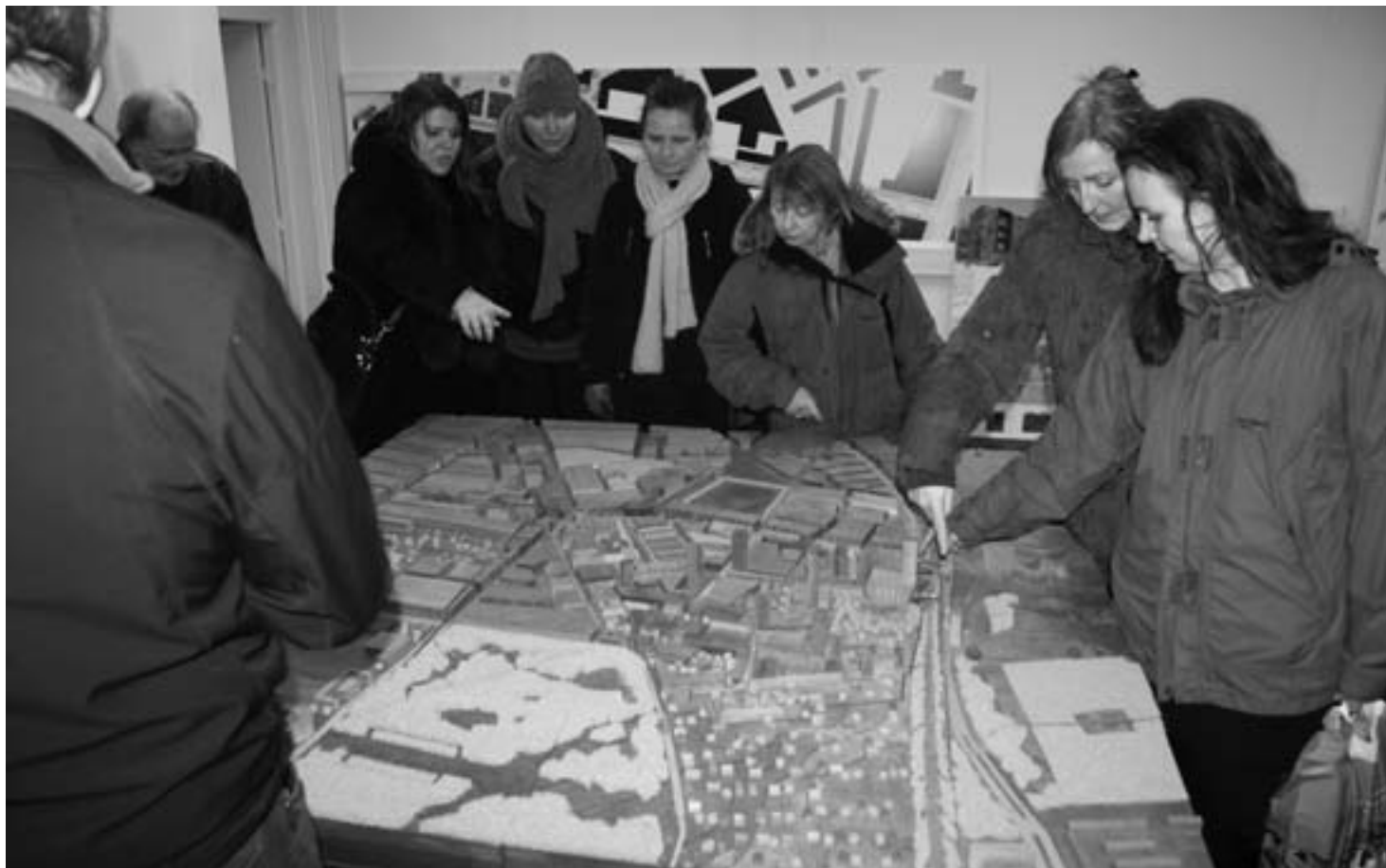
Planen for den nye Carlsberg kan ses i pavilionen lige efter elefanterne