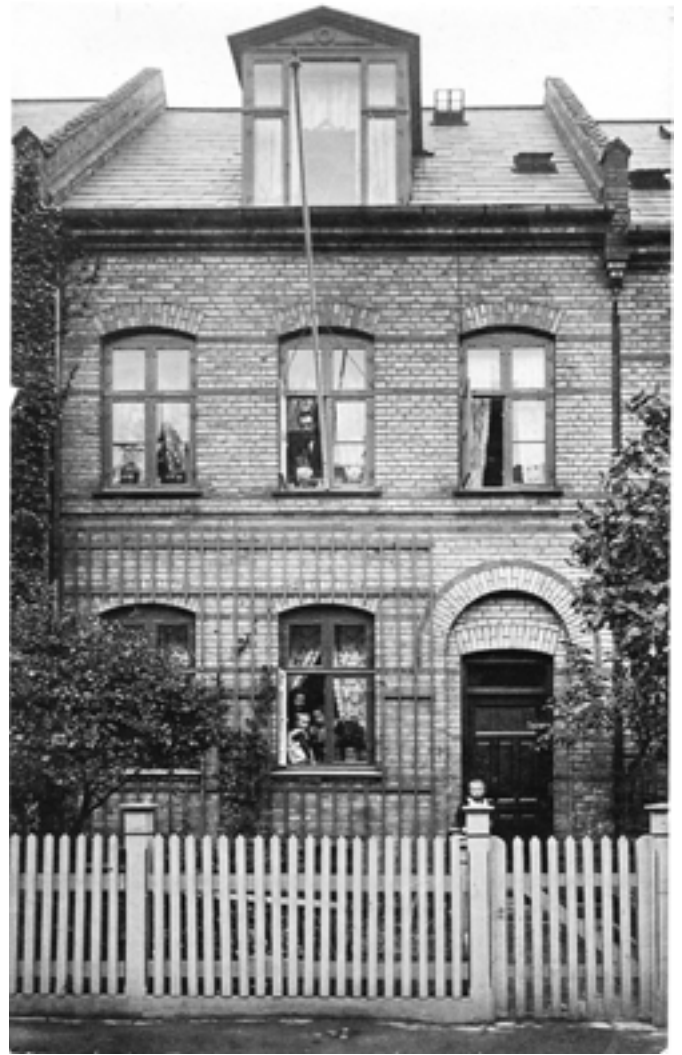
Sådan så Lundbyesgade 13 ud i 1920'erne