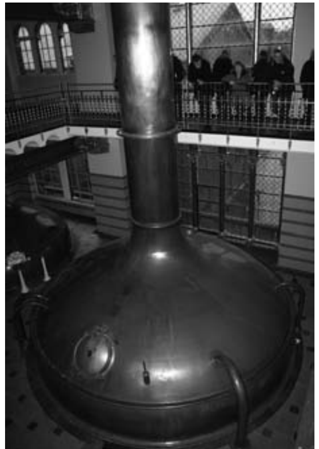
De flotte kobberkedler står i det gamle bryghus som skal blive til "Brand and Experience Centre"