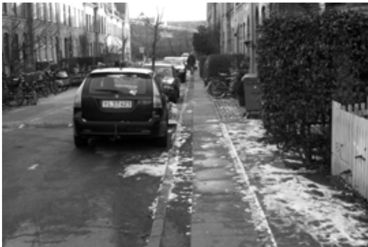
I Jerichausgades bare ende, kan man vandre fornøjet på fortovet