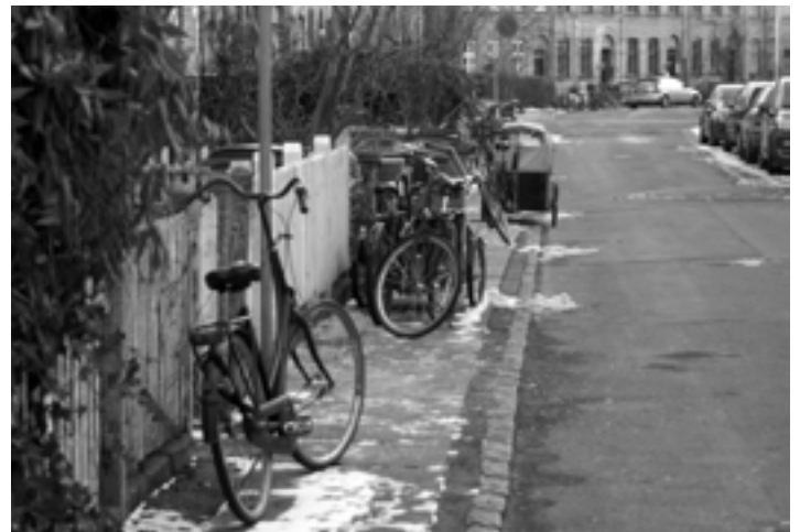
I andre gader er fortovet fyldt med cykler