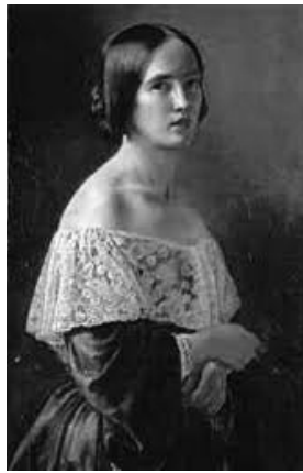
Baumann Jerichau og hendes mand Jens Adolf Jerichau.