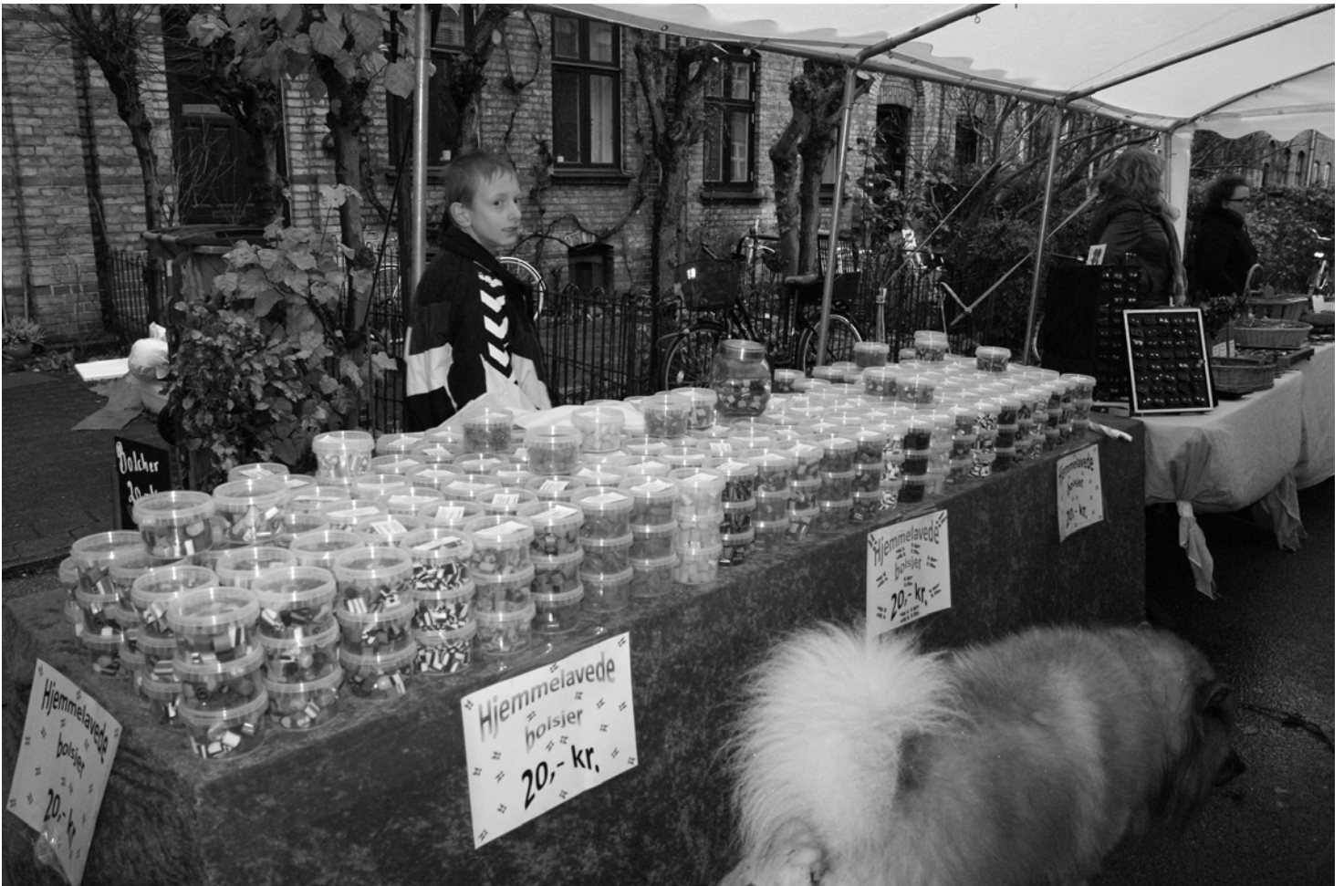
En fantastisk bolchebutik.