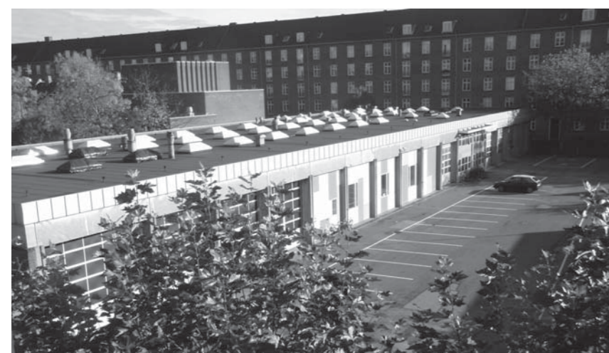
Gallerierne har åbent tirsdag-fredag i tidsrummet 12-17, lørdag 12-15