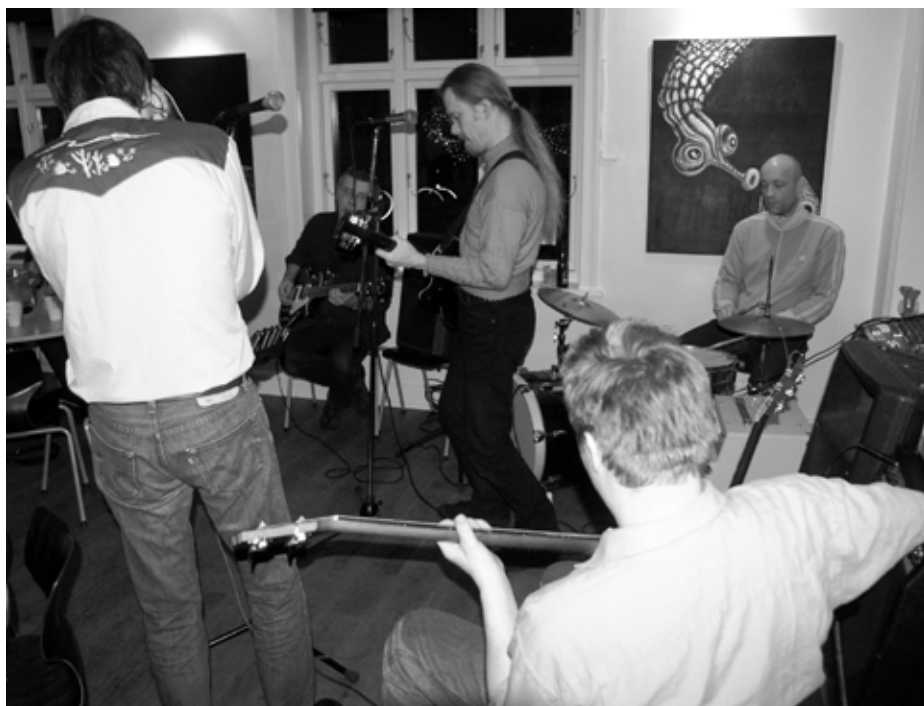
Natbandet byder på Cream-numre og solid blues-rock.

"I 80'er sættet bliver publikum nænsomt, men bestemt gennet ind i pop-rockens univers. Vi husker alle de gode gamle dage hvor alle havde samme frisure som Polle fra Snavel!", skriver bandet på sin hjemmeside: www.madsband.dk .