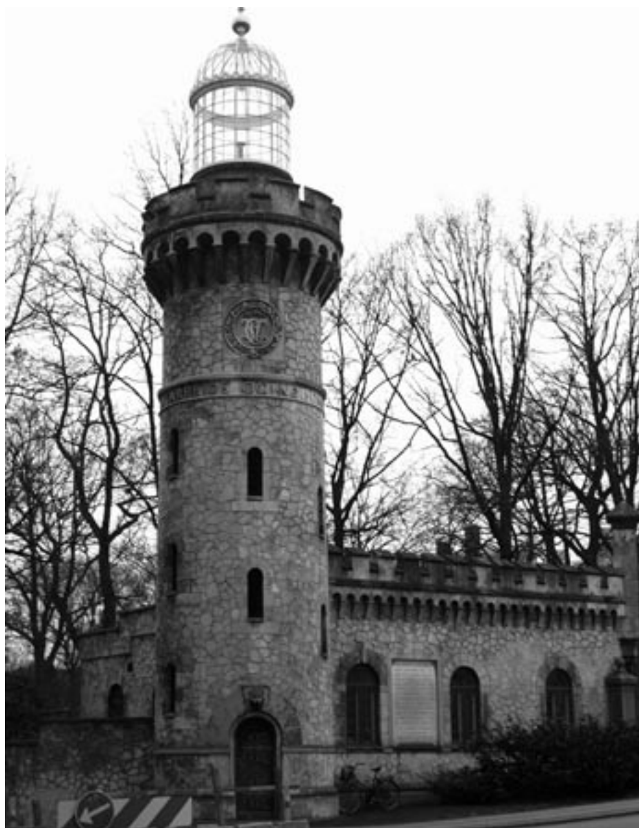
Arbejde og Nøjsomhed står med guldbogstaver på Fyrtårnet ved den gamle hovedindgang til Gamle Carlsberg