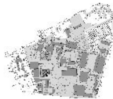
Se større illustration s. 12