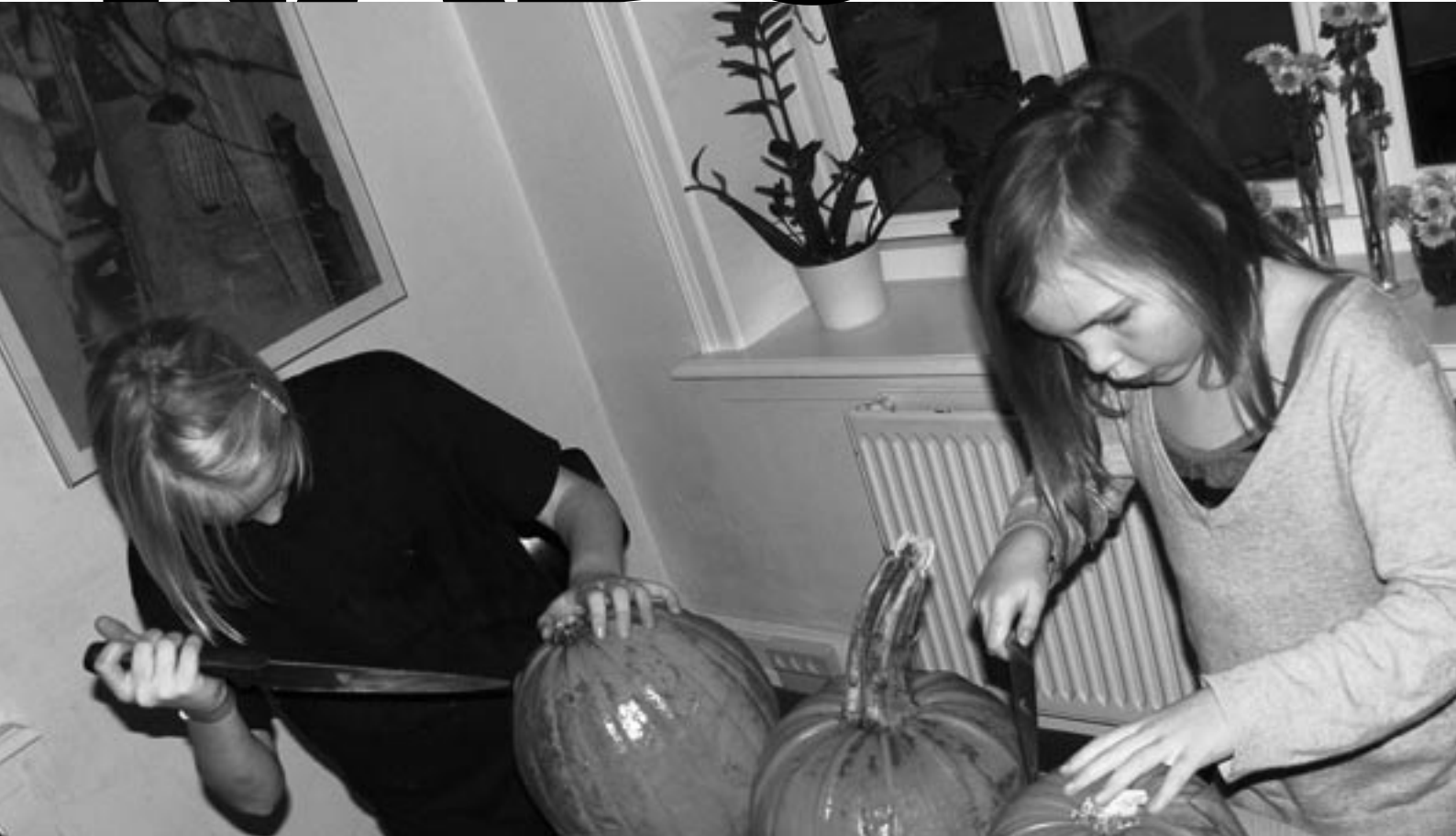
Gys og gru i Beboerhuset. Det var ikke for sarte sjæle at se pigerne snitte i græskarene. Forhåbentlig kom ingen til skade