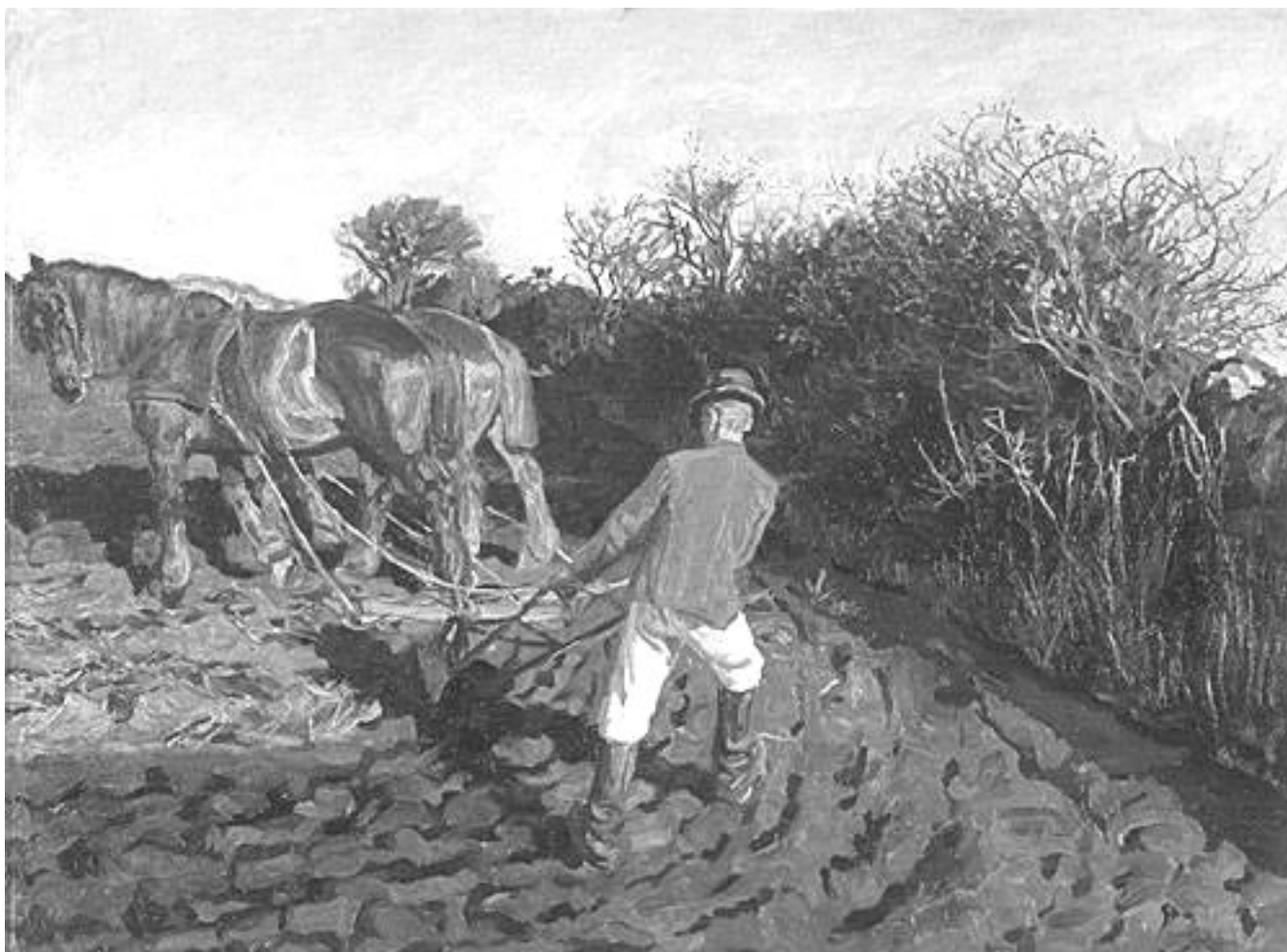
Peter Hansen: Pløjemanden vender. 1900-02. Faaborg museum