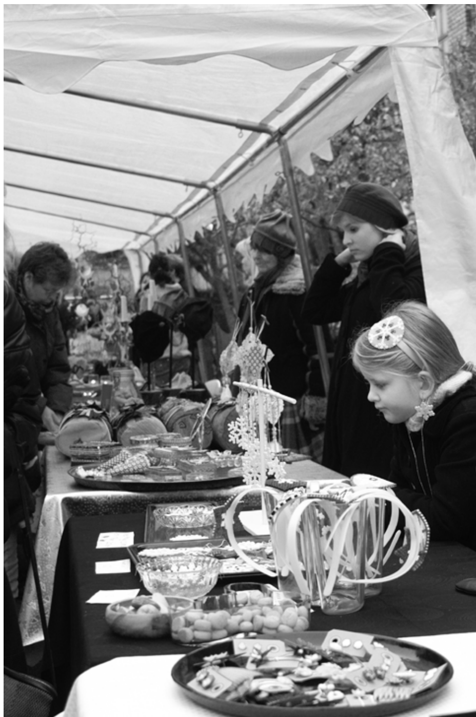
Beboerforeningens nye store telt var rejst som regnversforsikring. Det blev der ikke brug for, men teltet dannede alligevel en hyggelig ramme om de mange boder.