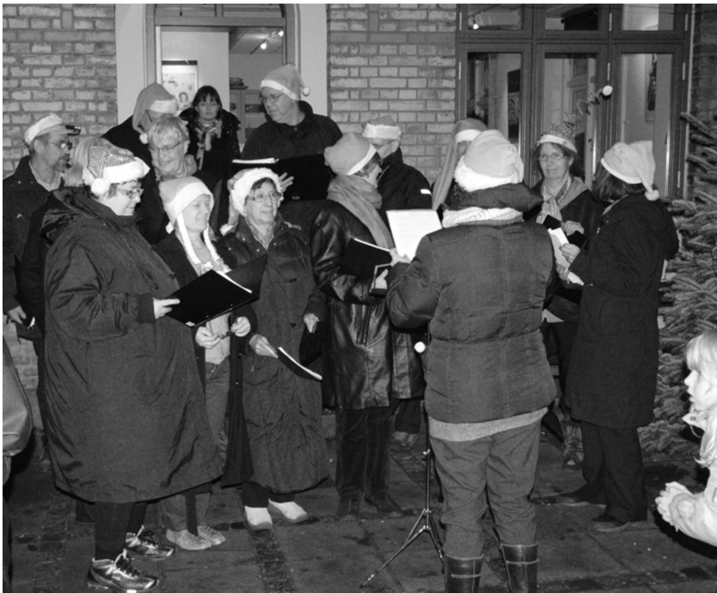
Sangkoret ØreVOX bidrog igen i år til den gode stemning på årets julemarked.

Årets julemarked overgik hvad vi har oplevet tidligere. Midtsiderne.