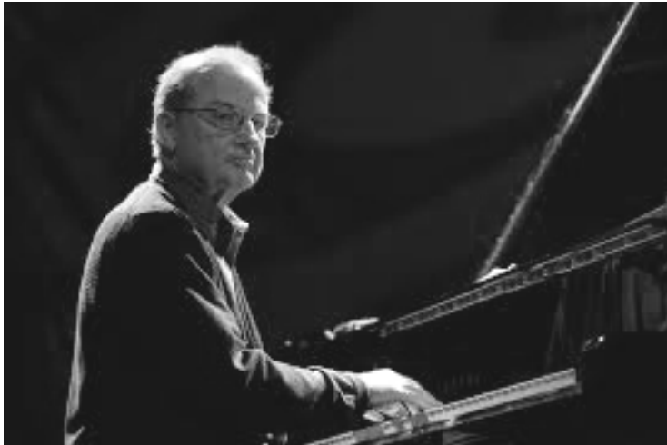
Ole Kock Hansen - kåret som landets bedste jazz-pianist.

Hun bliver akkompagneret af en mester, pianisten Ole Kock Hansen,