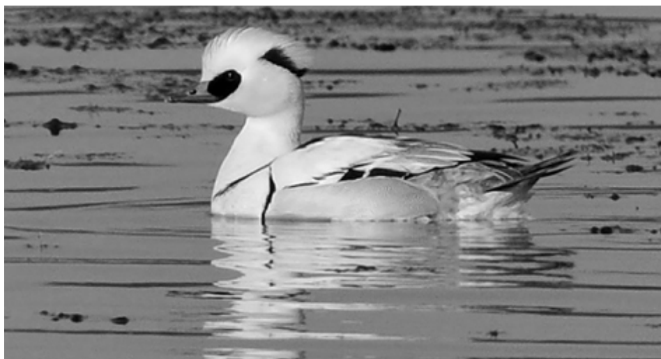
Lille skallsluger.

I disse uger, hvor vinteren har os i et sjældent jerngreb, er det værd for folk i Humleby at tage en tur ud til Sydhavnstippen eller slet og ret Tippen øst for Valbyparken ved Kalvebodernes fuglebeskyttelsesområde. Man kan cykle derud på 20 minutter, tage 3'eren til endestationen og gå de sidste par kilometer eller tage sine gåben gennem Vestre Kirkegård, men det sidste tager lidt længere tid. Tippen er opstået ved, at man i årene mellem 1945 og 1973 tippede bygningssaffald og restjord ud i vandet. Naturen/vegetationen er så opstået af sig selv oven på det skidt, men det har været nødvendigt senere hen at hjælpe naturen til at blive "naturlig" ved at bekæmpe flere invasive plantearter, bl. a. bjørneklo. Det er sket ved fældning og opgravning, men fra foråret 2009 er der udsat får på Tippens nordlige halvdel, og de er fantastiske til at æde de aggressive plantearter og samtidig modvirke, at Tippen bliver et ufremkommeligt vildnis.