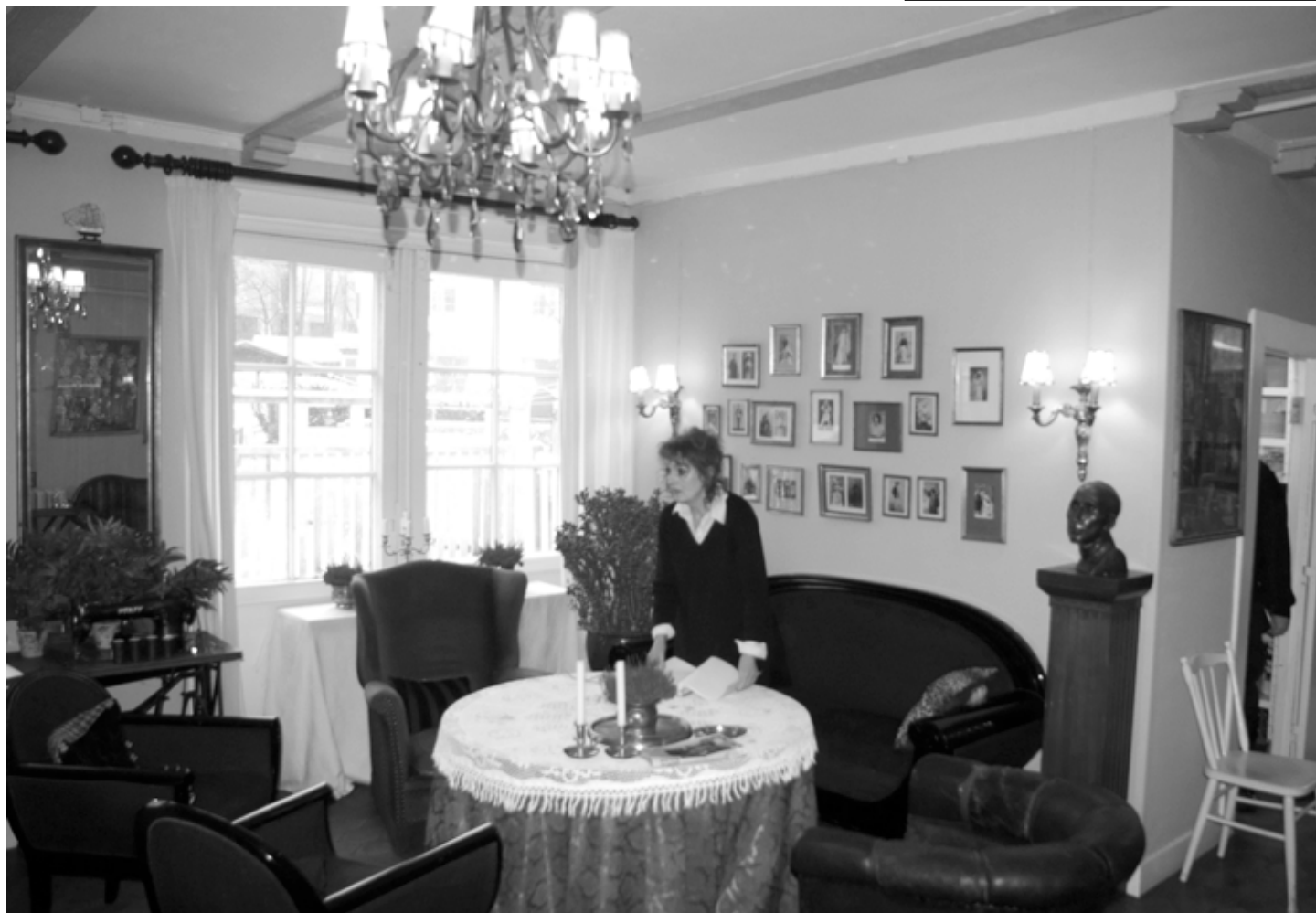
Teatrets foyer er en hyggelig klunketids-salon, hvor der er fuldt hus til "kaffe, kage og kloge koner".